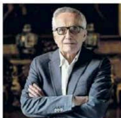
Il grande regista Marco Bellocchio