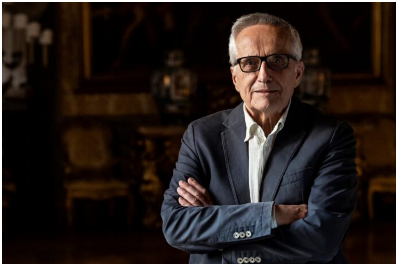
Marco Bellocchio

Venerdì 24 maggio la cerimonia di conferimento delle onorificenze al Maestro del cinema