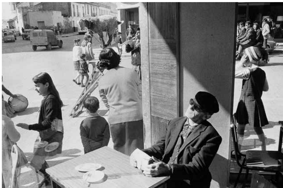
Joel Meyerowitz / Blind Man, Spain, 1967

Scrivi in maniera sintetica utilizzando una calligrafia leggibile.